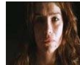
Severina: Muškarcu samo treba kurva